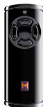
ProMatic Akku de série avec émetteur HS 4 BS noir

Autonomie : env. 40 jours** Durée de charge : 5 à 10 heures*** Poids : 8,8 kg Dimensions : 330 x 220 x 115 mm