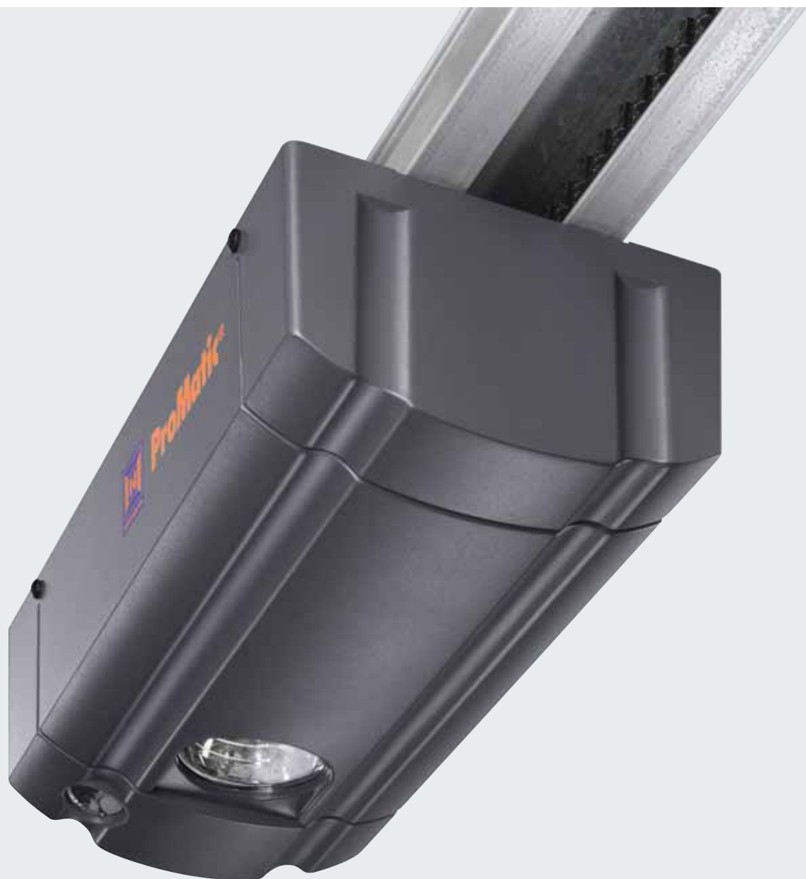
ProMatic De série avec émetteur HSE 2 BS noir

A l'instar des motorisations haut de gamme Hörmann, les motorisations de porte de garage ProMatic mettent en œuvre une technique éprouvée. La garantie d'un fonctionnement fiable à prix irrésistible.